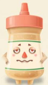
ドワスレッシュー

買ったことを忘れていた食品はありませんか？ 隠れていて捨てられる寸前のまだ使える食品 「ストックモンスター」たちに新たなチャンスと 与えるテクニックやグッズをお伝えします！