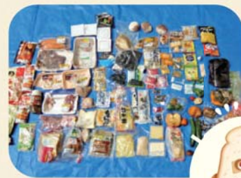
実際に捨てられていた手つかず食品